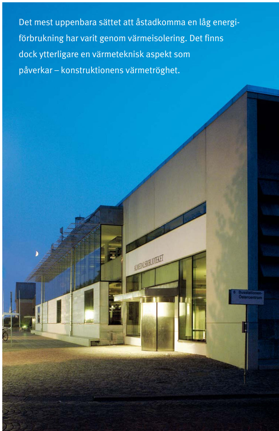
Almedalsbiblioteket i Visby. Med värmetröga konstruktioner finns det en potential att minska energiförbrukningen, kapa effekttopparna och förbättra den termiska komforten.

En värmetrög byggnad kan lagra överskottsvärme vid övertemperaturer, och sedan avge denna värme när temperaturen sjunker. Figur 1 illustrerar de vanligaste värmeflödena i en byggnad. Vi har värmeförluster genom klimatskalet, via ventilation och otätheter samt via bortspolat varmvatten. För att